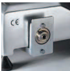
Meccanismo sgancio carro CE prof.