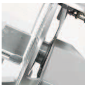
Ampio spazio tra lama e corpo macchina